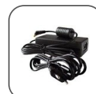
Kit adaptateur AC