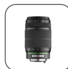
Objectif DA 55-300mm