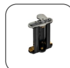
Tiroir batterie AA