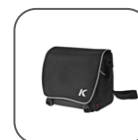
Sacoche « K »