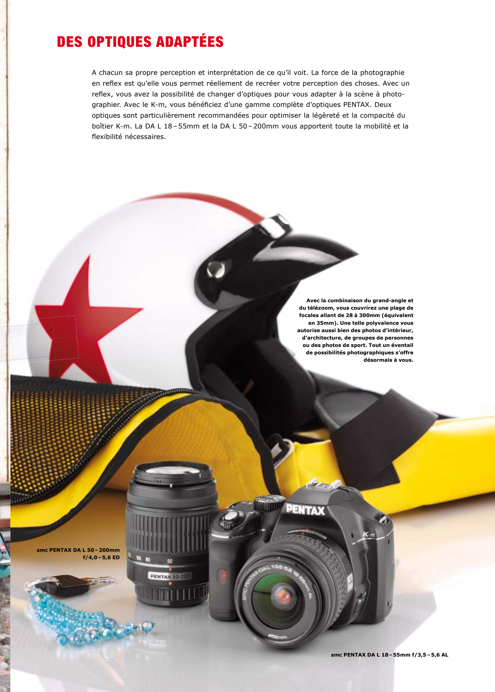
smc PENTAX DA L 50-200mm f/4,0-5,6 ED