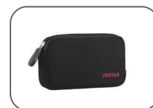
Étui en néoprène