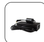
Kit adaptateur AC