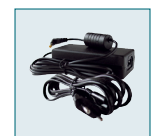
Kit adaptateur secteur K-AC8E