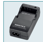
Chargeur de batterie D-BC8