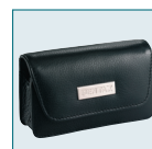
Housse en cuir LC-W1