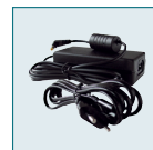
Chargeur de batterie K-AC7E