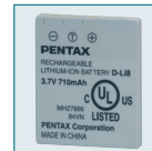
Batterie Li-ion D-LI8