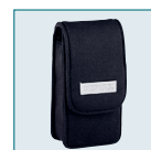
Housse en néoprène