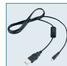
Câble USB I-USB7