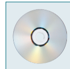
Logiciel ACD See S-SW48