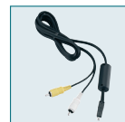
Câble AV I-AVC7