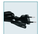
Cordon d'alimentation D-CO24E