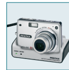
Station de charge D-BC42