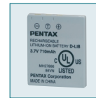
Batterie Li-ion D-LI8