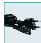
Câble AC D-CO2E