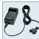
Kit Chargeur K-BC8E