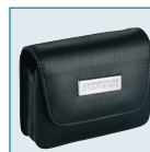
Etui cuir LC-A1