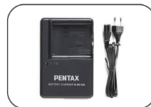
Kit chargeur de batterie