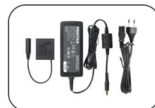
Kit adaptateur AC