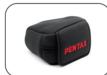
Étui en néoprène