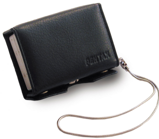
Etui cuir Luxury kit N° 50059