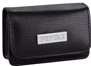
Etui cuir N° 50097