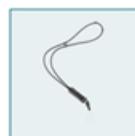
Dragonne en cuir