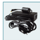
Kit adaptateur secteur