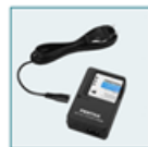
Kit chargeur batterie