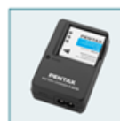
Chargeur de batterie