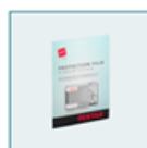
Jeu de films de protection (Ecran LCD 2,5")